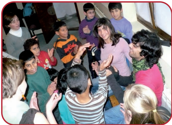
Die Kinder beim Musik-Programm der Freiwilligen

Das Vertrautmachen mit den Jugendlichen fiel nicht schwer. Von Anfang an besuchten sie uns oft in unserer Wohnung, was man nachteilig und vorteilig sehen kann. Zum einen fühlten wir uns gerade am Anfang oft überfordert mit dem Ansturm der Jugendlichen, zum anderen konnten wir uns dadurch viel schneller kennenlernen. Inzwischen wissen wir besser, wie wir mit ihnen umgehen können. Wir selbst lernen schneller, Konfliktpunkte anzusprechen und suchen immer schnell nach Lösungen für Probleme, sowohl mit den Jugendlichen als auch unter uns.