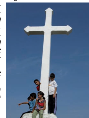
Das Kreuz auf dem Berg gab der Stadt ihren Namen – Cristuru-Secuiesc

Wir danken ganz herzlich den vielen Einzelspendern und Sponsoren!